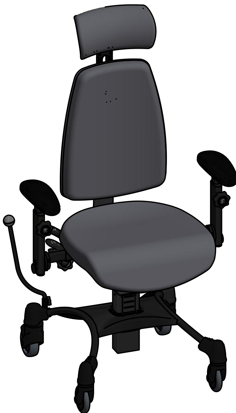
VELA Tango 510E