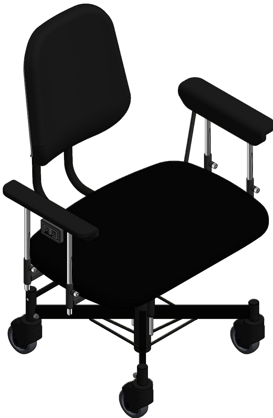
VELA Tango 310E