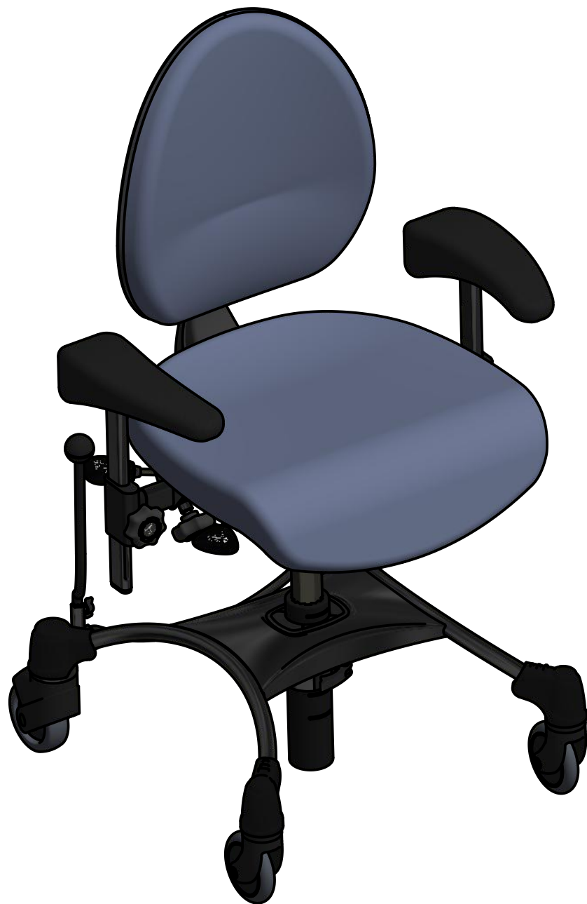
VELA Tango 200FB