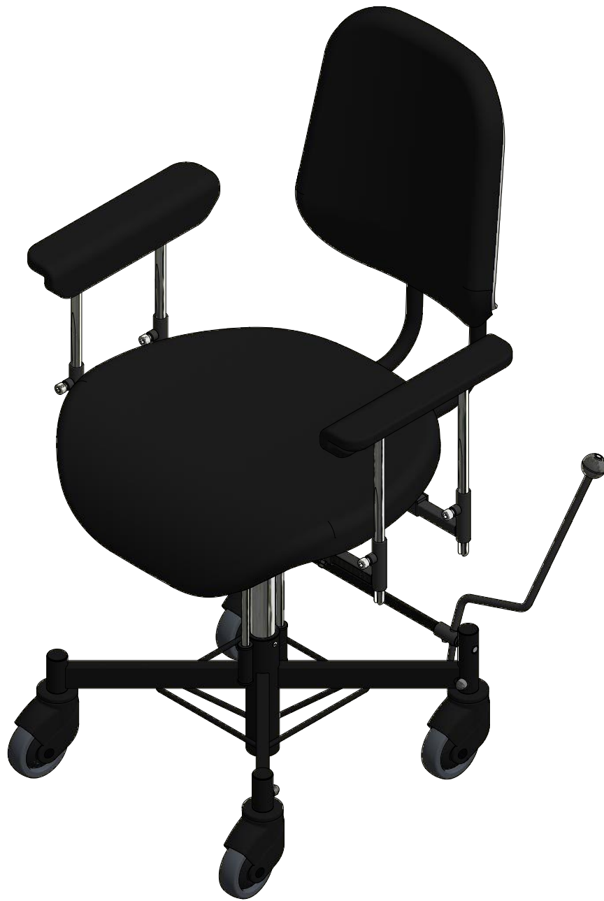
VELA Tango 300E