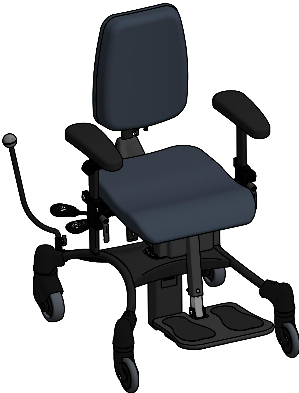
VELA Tango 100 ES