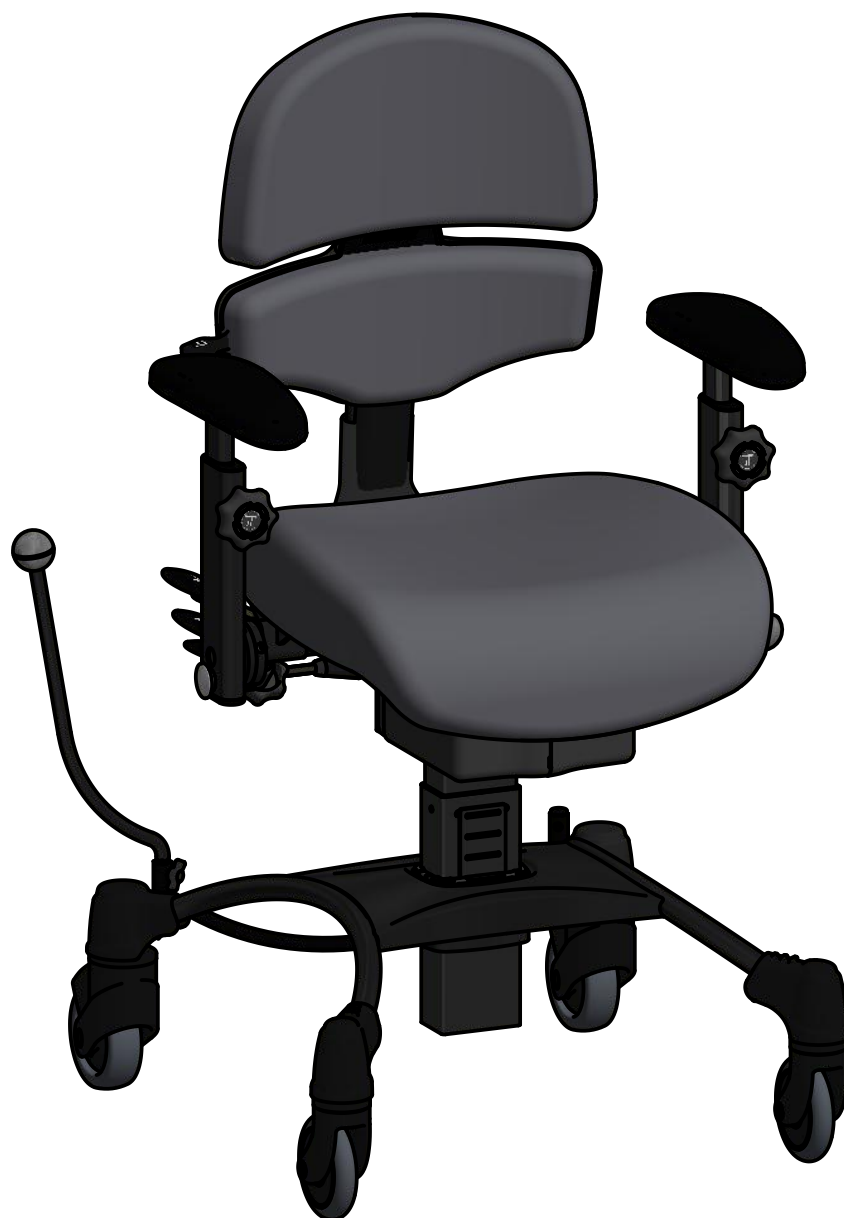
VELA Tango 500E ALB small