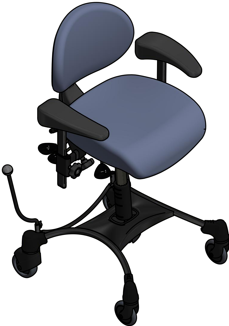
VELA Tango 100