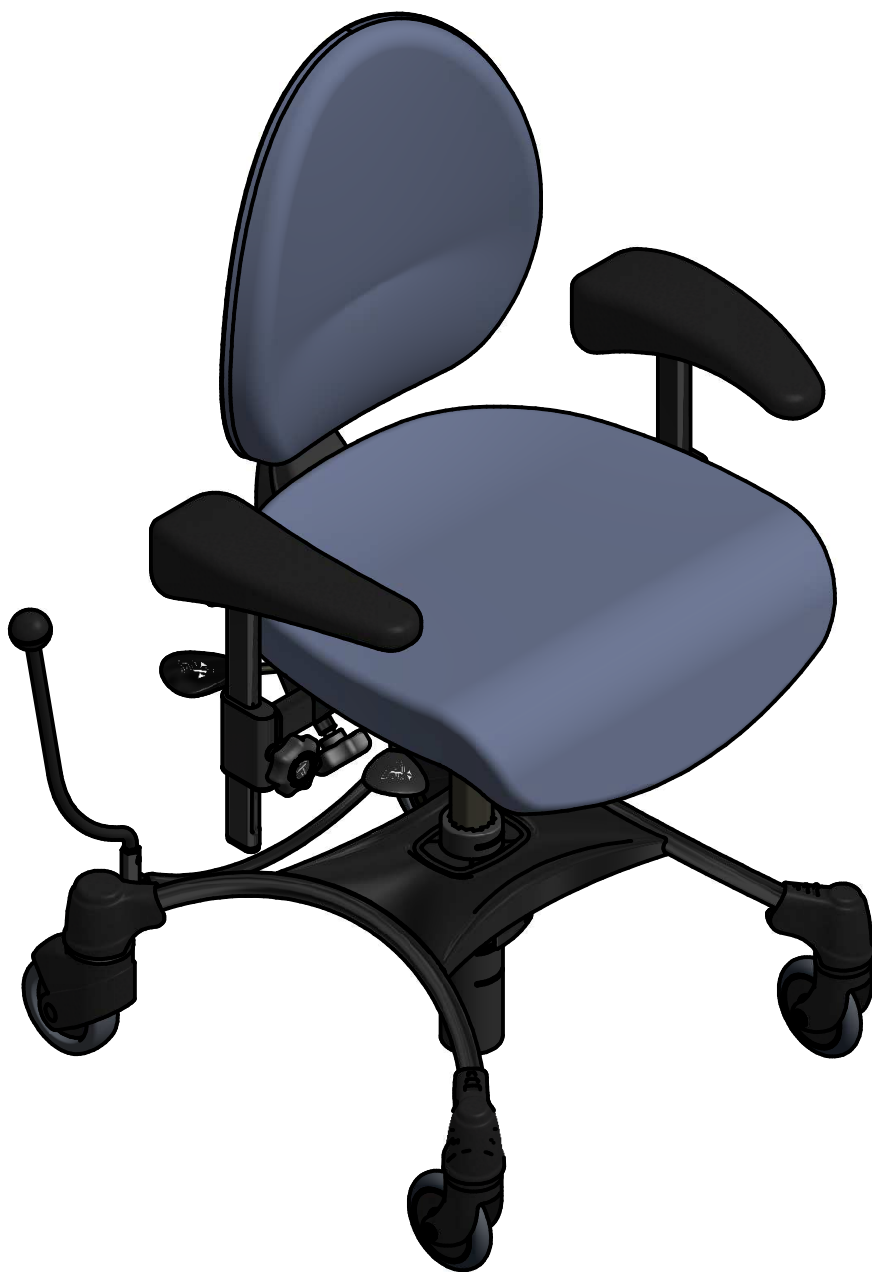
VELA Tango 200FB