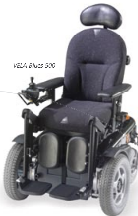
VELA Blues 500

VELA Blues 500 er en rigtig smart el-kørestol, der giver børn og unge mulighed for at færdes såvel ude som inde. VELA Blues 500s lidt rå "look" signalerer viljen til at være med, hvor det sker – uden begrænsninger.