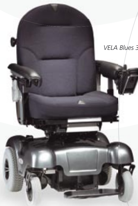
VELA Blues 300

VELA Blues 300 er en kompakt lille stol med en lille venderadius. Den kan, som den eneste, svinge sædet 180 grader, hvilket giver den to væsentlige fordele: