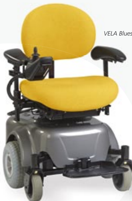
VELA Blues 200

Den klarer også begrænset udendørskørsel, hvis der er fast køreunderlag.