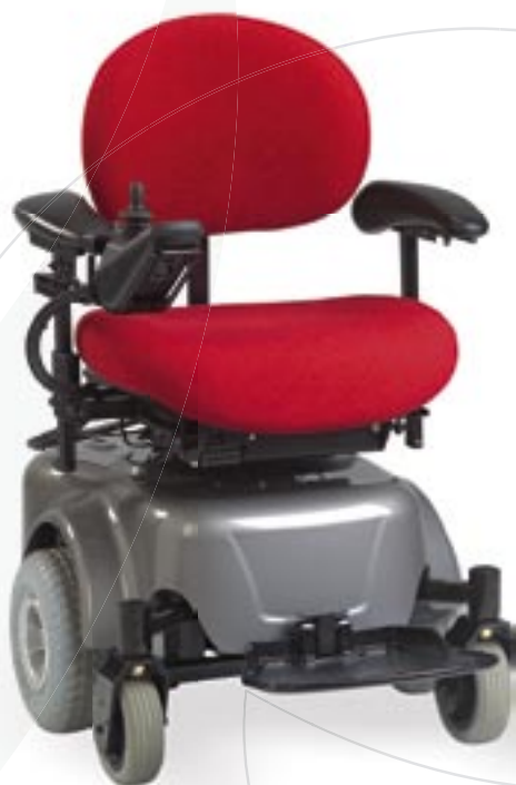
VELA Blues 200 med arbejdsstols-sæde