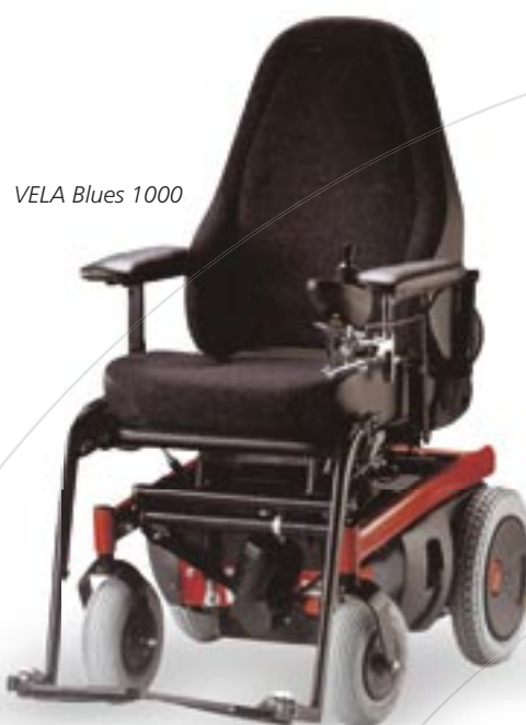
VELA Blues 1000

VELA Blues 700/1000 er den perfekte el-kørestol til byture, sportsbegivenheder, skovture og indkøb. Ud over at være terrængående er den i kraft af det gennemtænkte og kompakte design samtidig manøvredygtig både hjemme i boligen og på jobbet.