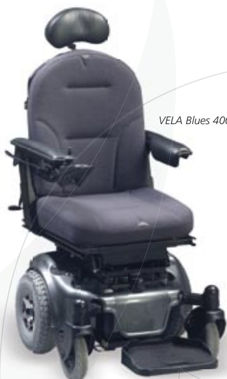
VELA Blues 400

VELA Blues 400 er en centerdrevet kørestol med leddelt chassis. Det betyder, at den svinger lige præcis omkring kroppens lodlinje – på nøjagtig samme måde som en gående bevæger sig – og den gør det derfor nemt at manøvrere rundt blandt møbler og mennesker.