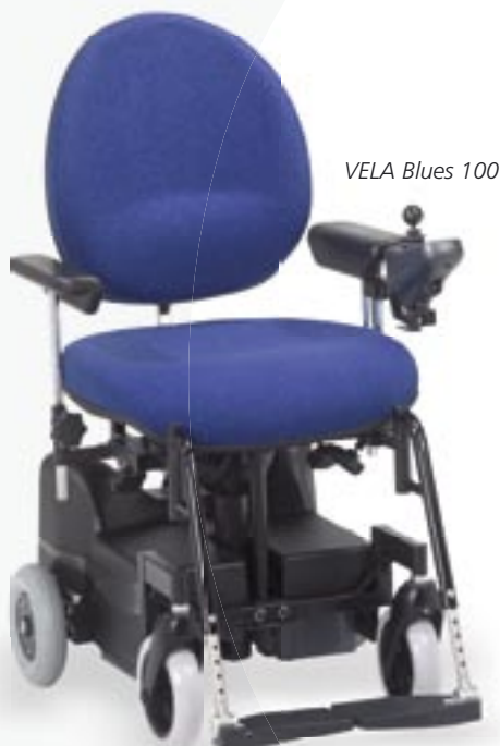
VELA Blues 100

VELA Blues 100 er primært beregnet til indendørs brug, men kan også anvendes til småture i de nære omgivelser. Der er tale om en kombineret kontorstol og el-kørestol, hvor fordelene fra begge er samlet i en og samme stol. Den særdeles kompakte stol kan køre op og ned som en kontorstol, så brugeren nemt kan flytte sig fra f.eks. en almindelig stol over i el-kørestolen.