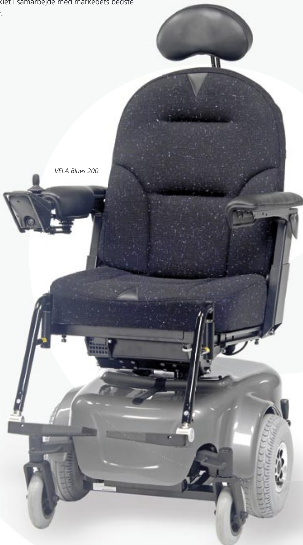
VELA Blues 200

Optimal ergonomisk udformning, høj kvalitet og lang levetid er de vigtigste parametre hos VELA, når vi designer el-kørestole. El-kørestolenes mekaniske dele er udviklet i samarbejde med markedets bedste leverandører.