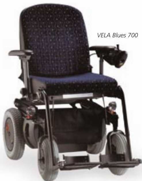
VELA Blues 700